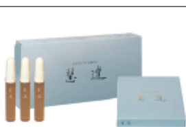
乳酸菌花粉発酵物 慧達 (えいたつ)